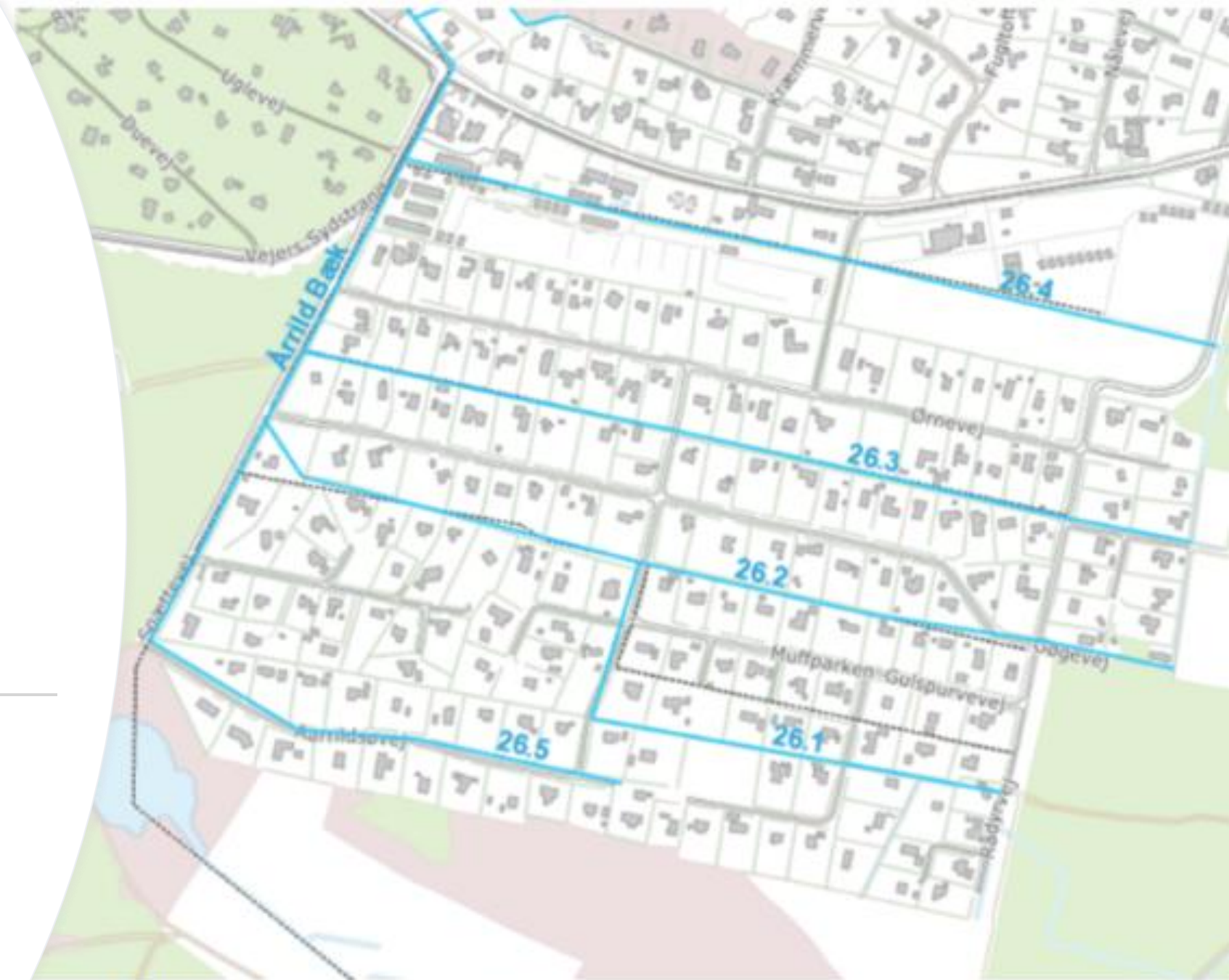
Fig. 1 Årrild bæk og rørledningerne.